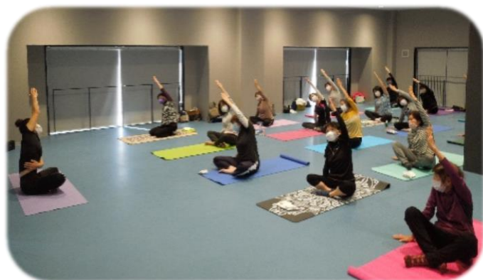
シニアヨガ・健康体操教室 10:00～10:50