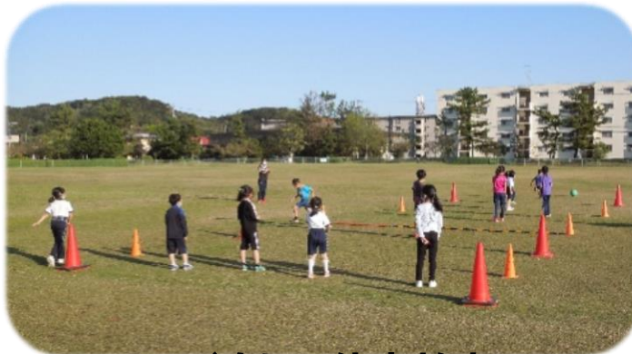
キッズ楽しい体育教室 16:00～16:50