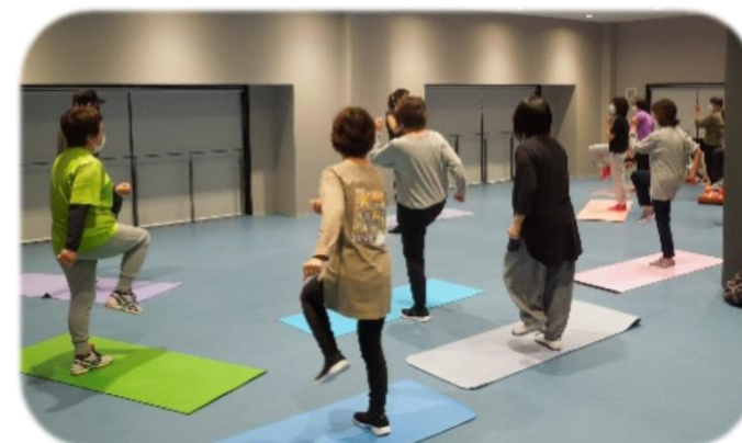
リズムワークアウト教室 19:00～19:50

専門インストラクターによる多世代の方を対象とした 楽しく身体を動かせる健康教室を開催中です!